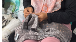
Gambar 10. Penjahitan Logo Pin Sikambang Manih