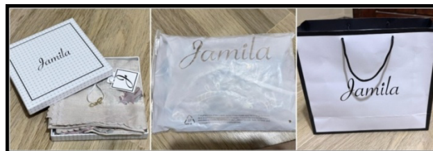
Gambar 12. Contoh Packaging