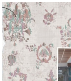
Gambar 4. Detail Motif Pengembangan Sikambang Manih