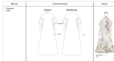
Gambar 5. Technical Drawing Dress Sikambang Manih