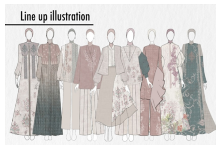
Gambar 3. Desain Busana Sikambang Manih