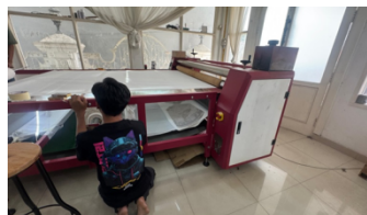
Gambar 8. Proses Press dari Transfer Paper ke Kain