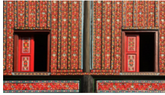
Gambar 1. Ukiran Dinding Rumah Gadang

proporsional. Pengulangan bentuk secara teratur dan keseimbangan visual diperhatikan agar motif yang dihasilkan