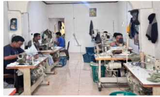
Gambar 9. Proses Menjahit