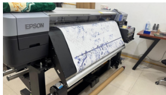
Gambar 7. Mesin Printing Transfer Paper