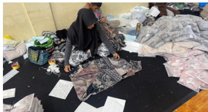
Gambar 11. Proses Packaging