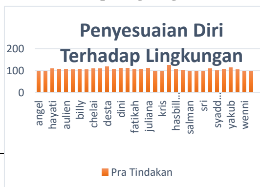
Gambar 1. Grafik Penyesuaian Diri Terhadap Lingkungan Sekolah Siswa Pra Tindakan

Berdasarkan hasil analisis pada tabel di atas, terdapat 3 % kategori tinggi, 72% kategori sedang dan 25% kategori rendah. Guna melihat angket penyesuaian diri terhadap lingkungan sekolah secara keseluruhan agar kita dapat melihat sebatas mana penyesuaian diri terhadap lingkungan sekolah siswa tersebut sebelum di beri tindakan. Dan ini akan di jadikan tolak ukur pada saat setelah tindakan dilakukan apakah tindakan berhasil atau tidak. Hasil analisis ini dapat dilihat dari data dibawah ini.