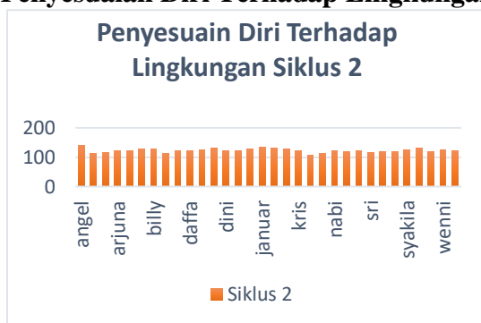
Gambar 3. Grafik Penyesuaian Diri Terhadap Lingkungan Sekolah Siswa Siklus 2

Berdasarkan hasil analisis pada tabel di atas, terdapat 66 % kategori sedang dan 34% kategori tinggi. Guna melihat angket penyesuaian diri terhadap lingkungan sekolah secara keseluruhan agar kita dapat melihat sebatas mana adaptasi lingkungan tersebut setelah di beri tindakan. Dan ini akan di jadikan tolak ukur pada saat setelah tindakan dilakukan apakah tindakan berhasil atau tidak. Hasil analisis ini dapat dilihat dari data dibawah ini.