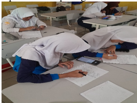
Gambar 3. Peserta didik mengerjakan tugas mengulas karya fiksi

bawah 60, tetapi meningkat menjadi di atas 70 setelah menggunakan media film pendek. Hal ini menegaskan bahwa media audiovisual memberikan kontribusi positif terhadap pemahaman siswa pada materi ulasan karya fiksi. Seperti terlihat pada gambar berikut :