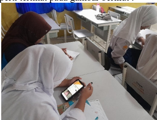
Gambar 2. Peserta didik memperhatikan film pendek

Pada pertemuan pertama, guru mempersiapkan perangkat ajar berupa modul, LKPD, film pendek, dan daftar hadir. Kegiatan pembelajaran diawali dengan salam, doa, pengecekan kehadiran, penyampaian tujuan pembelajaran, serta pertanyaan pemantik terkait konsep karya fiksi. Guru kemudian menjelaskan pengertian, struktur, dan contoh ulasan karya fiksi. Media pembelajaran berupa film pendek berjudul “ Kurus Berprogres ” ditayangkan untuk diamati siswa. Guru memberi arahan agar siswa mencatat unsur-unsur penting seperti tema, tokoh, alur, latar, dan amanat. Selama kegiatan inti, siswa menunjukkan antusiasme tinggi, mencatat aspek penting film, serta berdiskusi mengenai unsur-unsur yang ditemukan. Mereka mengerjakan tugas mengulas karya fiksi berdasarkan struktur yang telah dipelajari. Guru aktif mendampingi, memberikan arahan, memastikan siswa memahami instruksi, dan memfasilitasi pertanyaan. Pada kegiatan penutup, guru memberikan apresiasi, meminta siswa menyampaikan kesimpulan, serta menegaskan kembali materi sebelum pembelajaran ditutup. Hasil observasi menunjukkan bahwa penggunaan film pendek meningkatkan minat, konsentrasi, dan pemahaman siswa terhadap materi ulasan karya fiksi. Seperti terlihat pada gambar berikut :