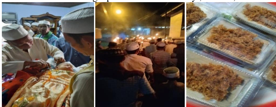
Perlengkapan Tradisi Hari Assyura 10 Muharam