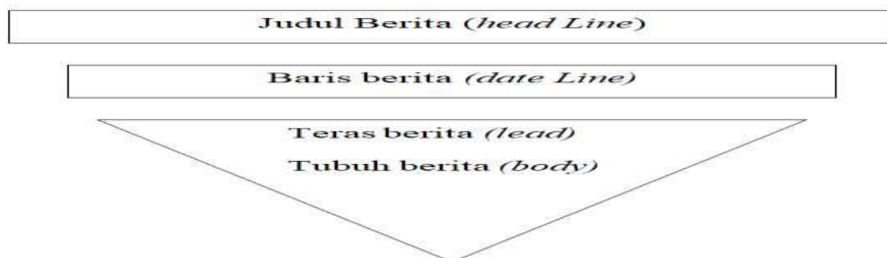
Gambar 2. Gaya Penulisan Berita

Assegaf (1991:49) menyatakan dalam memenuhi persyaratan bentuk hendaknya memperhatikan gaya penulisan piramida terbalik, seperti pada gambar dibawah ini, :